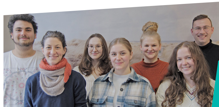
UNSERE EHRENAMTLICHEN MITARBEITER:INNEN