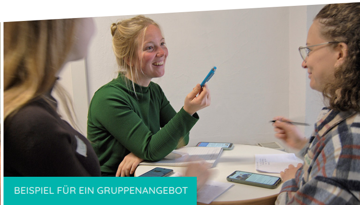
BEISPIEL FÜR EIN GRUPPENANGEBOT