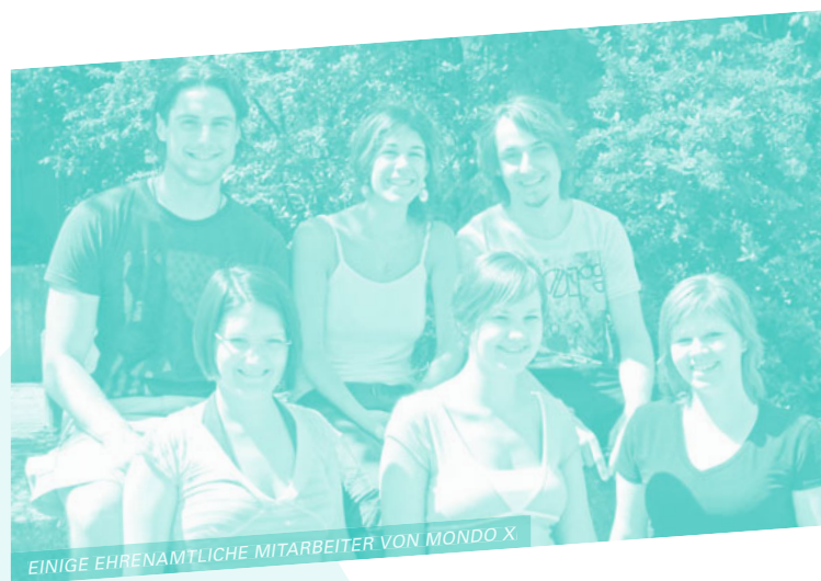
EINIGE EHRENÄMTLICHE MITARBEITER VON MONDO X

Diakonie Mitglied im Diakonischen Werk der Ev.- luth. Landeskirche in Braunschweig e.V.