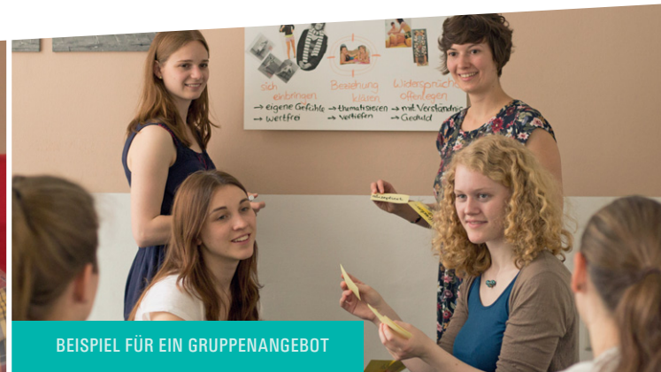
BEISPIEL FÜR EIN GRUPPENANGEBOT

Mit Ihrer Spende tragen Sie dazu bei, dass Jugendliche und junge Erwachsene weiterhin von unserer Arbeit profitieren.