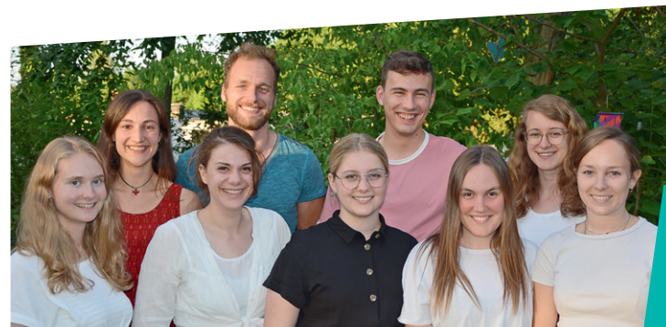
UNSERE EHRENAMTLICHEN MITARBEITER-/INNEN